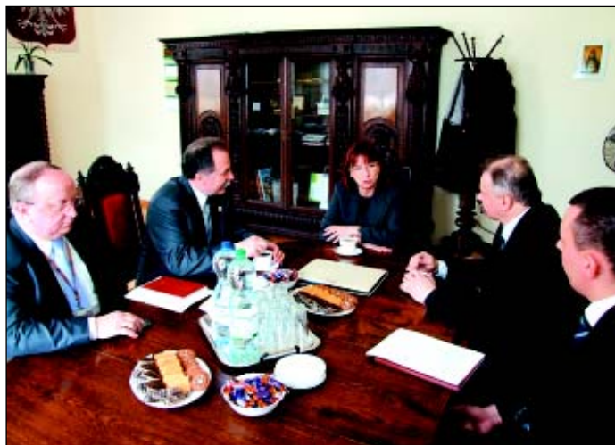
W gabinecie burmistrza

Po otwartym spotkaniu z mieszkańcami miast i gmin odbyło się zwiedzanie zamku sulechowskiego i kompleksu sportowo - rekreacyjnego Ośrodka Sportu i Rekreacji.