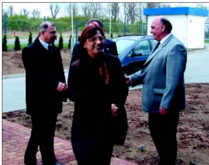
Z wizytą w Roltexsie