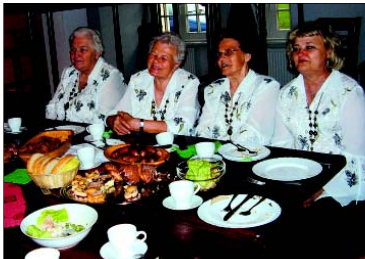
Kargowianki przy stole biesiadnym na zakończenie imprezy