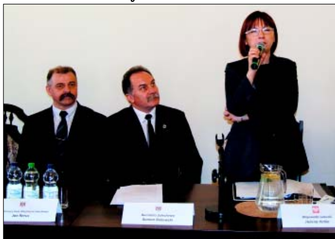
Na spotkaniu z radnymi