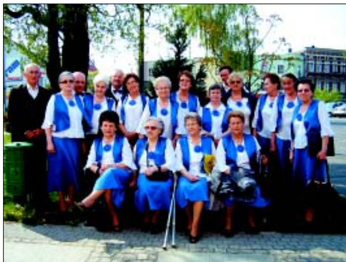
Sulechowskie promyczki z Centrum Usług Socjalnych.