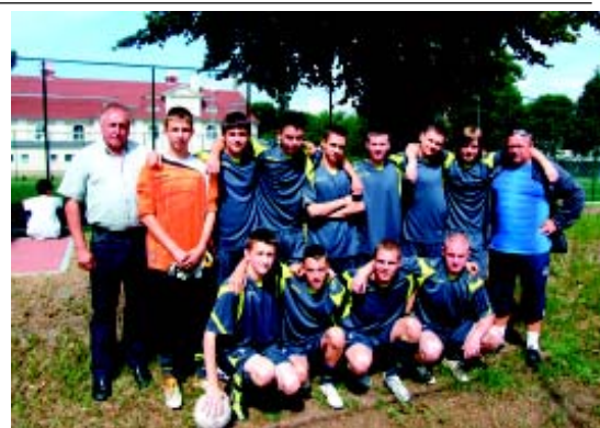
Zwycięska drużyna z Przylepu

Pozostałe miejsca zajęły szkoły w: Sulechowie, Pomorsku, Trzebiechowie, Zaborze, Świdnicy, Dąbiu, Bojadłach.