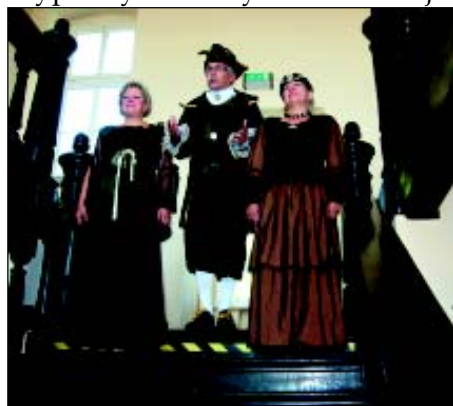
Bakalarze w pałacu rodziny von Sydow z Kalska.

XVI plener Ogólnopolskich Spotkań Artystycznych organizowany przez Lubuski Okręg ZNP, w tym roku zagościł na 10 lipcowych dni w Gminie Sulechów, a konkretnie w Kalsku. Uczestnicy - 25 artystów amatorów (literaci, malarze, fotograficy) z całego kraju mieszkali w hotelu ODR, a za twórcze inspiracje służyły im: zespół pałacowy w Kalsku, zabytkowa architektura Sulechowa i piękno przyrody w Łagowie. Artyści to laureaci konkursu pn. "Natura moich okolic", którzy na plenerze doskonalili swoje umiejętności pod okiem konsultantów z Warszawy i Zielonej Góry. W połowie pobytu, na zielonogórskim deptaku przy pomniku Bachusa, laureaci konkursu odebrali nagrody i dyplomy oraz wystawiali swoje