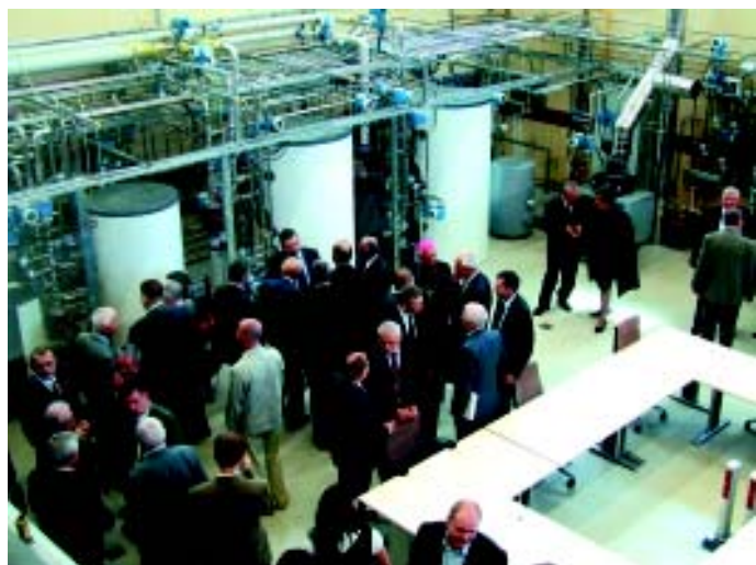
Centrum Energetyki Odnawialnej spotkało się z dużym zainteresowaniem przedsiębiorców.