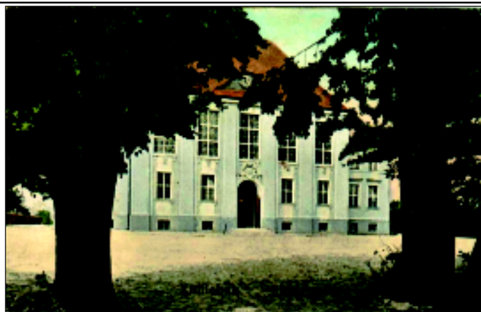
Zdjęcie: pedagogium.jpg - podpis: Budynek pedagogium ok. 1911 r. (Gebr. Heberlein, Zwickau)

od pierwszych dni Sulechów stał się silnym ośrodkiem edukacyjnym, a przeniesienie do tej placówki Liceum Pedagogicznego na długie lata związało miasto ze środowiskiem nauczycielskim. Hasło szkoły z 1766 roku Non scholae, sed vitae discimus znajdujące się od 1911 roku na witrażach okiennych auli, jest tam nadal aktualne 19 .