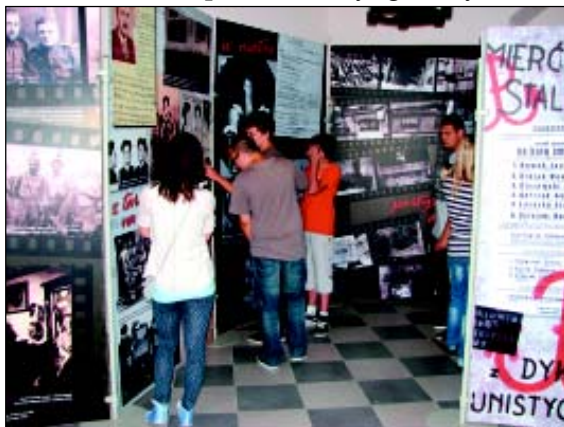
Sulechowscy gimnazjaliści zwiedzają wystawę.

Organizatorami wszystkich wydarzeń byli: Instytut Pamięci Narodowej - Oddział w Poznaniu, Państwowa Wyższa Szkoła Zawodowa w Sulechowie, Sulechowski Dom Kultury oraz Stowarzyszenie Praworządny Sulechów.