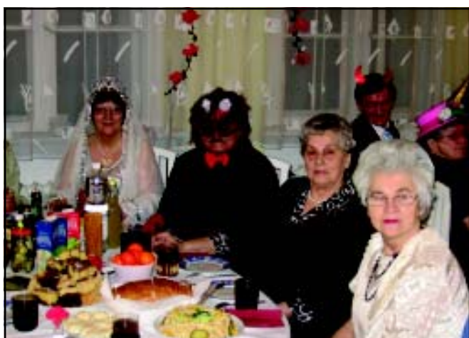
Frykasy na stole przygotowali uczestnicy Balu Walentynkowego