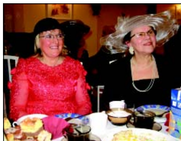
Dama Kierowa i Dama Pikowa