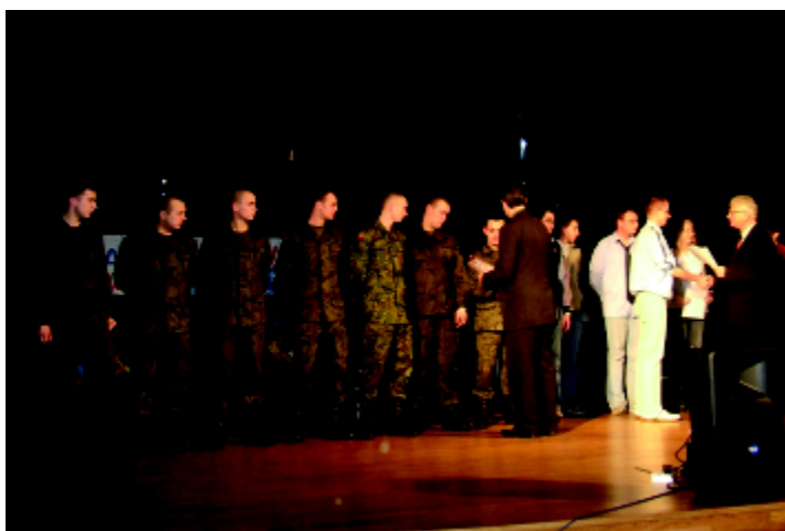
Liczną grupę wolontariuszy stanowili żołnierze służby zasadniczej sulechowskiego pułku